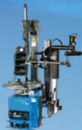
MONTY® 3550 GP PLUS

Elegir las herramientas y el equipo adecuados puede transformar su negocio automotriz. Cuando equipa su taller con desmontadoras de neumáticos Hofmann®, está invirtiendo en un conjunto de beneficios que promueven una mayor productividad, una mayor seguridad y un elevado margen de beneficio. En un taller de reparación de automóviles, cada segundo cuenta. Los retrasos en el cambio de neumáticos pueden provocar tiempos de servicio más prolongados, clientes menos satisfechos y una disminución de la productividad general. Las máquinas desmontadoras de neumáticos Hofmann® están diseñadas para mitigar estos desafíos. Cada máquina que ofrecemos está diseñada para optimizar la velocidad sin comprometer la precisión.