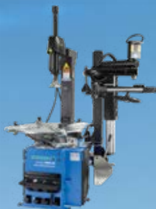
MONTY® 3300-22 SMARTSPEED / GP PLUS