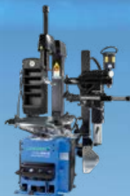
MONTY® 3300-24 SMARTSPEED / GP PLUS