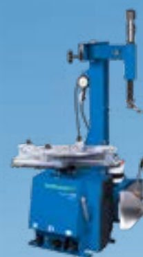
MONTY® 1270 SMART